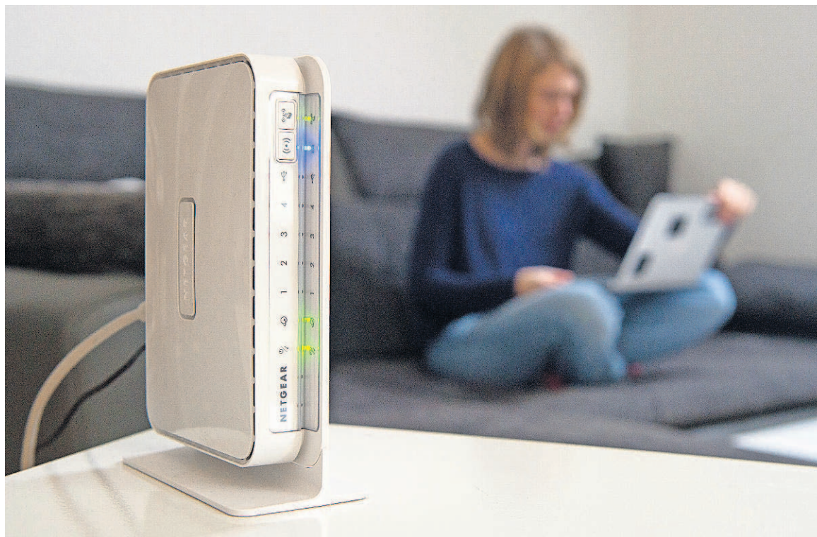
Die unsichtbaren elektromagnetischen Wellen, die WLAN-Router zur Datenübertragung aussenden und empfangen, verraten, ob eine Personen in der Nähe des Routers sitzt oder steht.